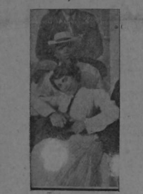
El negro Johnson con su esposa

París tiene un rey... Es el negro Jack Johnson, que se pasea a todas horas por el bulevar haciendo volatidades inauditas en su automóvil y exhibiendo su torso de bestia y su boca resplandeciente de oro.